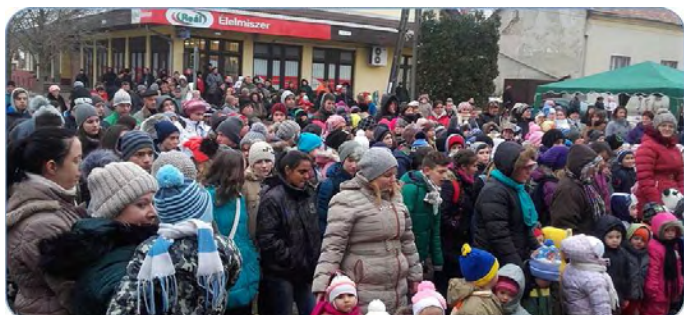
Az ünneplők egy csoportja a vértesi részen