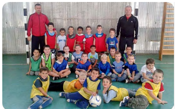
Létavértes SC 97 óvodás fiú focistái

Szalai Ferencné Létavértesi Vöröskereszt véradásszervező