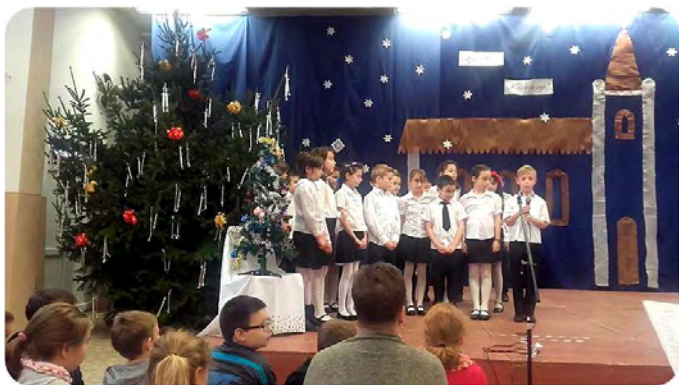
A 3. osztályosok műsora