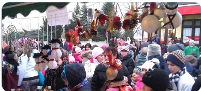
Kirakodóvásár az Irinyi utca elején