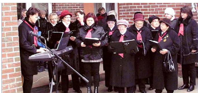
A Nagylétei Református Egyházközség énekkara