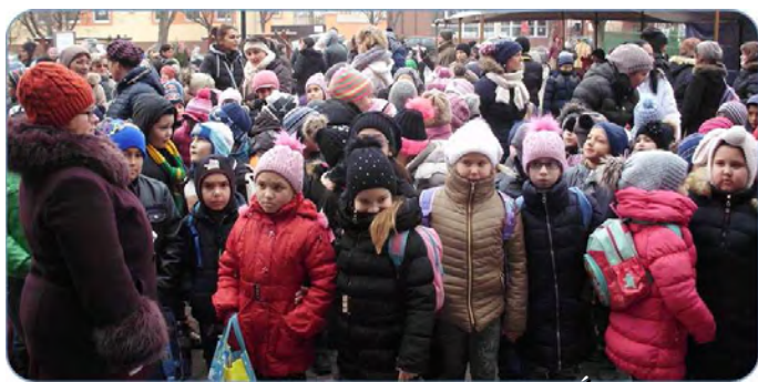
Az ünnepség résztvevőinek egy csoportja az Árpád téren